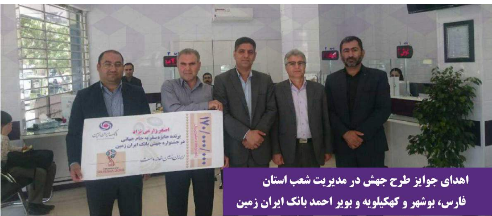
اهدای جوایز طرح جهش در مدیریت شعب استان فارس، بوشهر و کهگیلویه و بویر احمد بانک ایران زمین