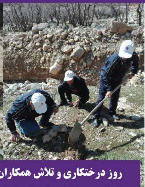
روز درختکاری و تلاش همکاران ایلام در کاشت نهال بلوط در جنگلهای بلوط استان ایلام